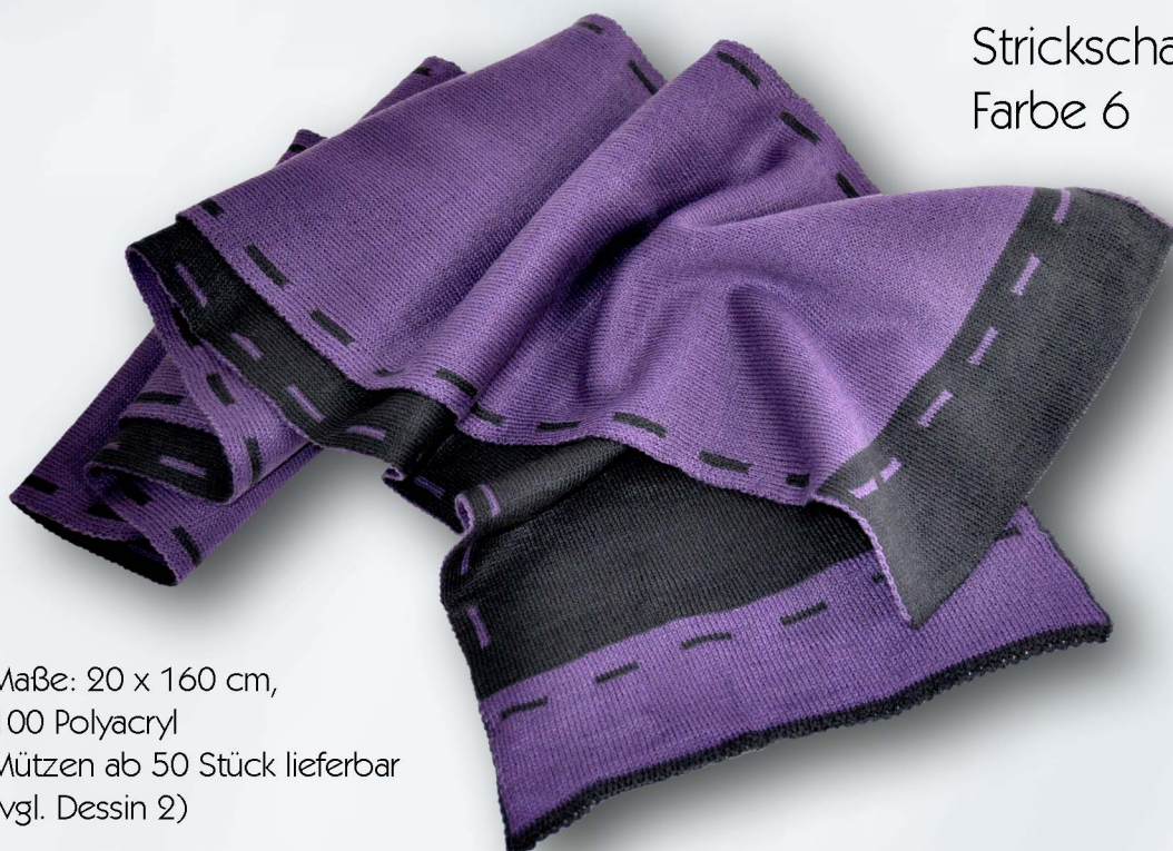
Strickschal Dessin 1, Stitch Farbe 6

Maße: 20 x 160 cm, 100 Polyacryl Mützen ab 50 Stück lieferbar (vgl. Dessin 2)